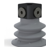
Referência da variação: 96 52NR 18D-3-BD