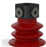
Referência da variação: 96 52SL 18D-3-BD