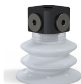
Referência da variação: 96 52SLT 18D-3-BD