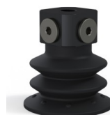
Referência da variação: 96 52NI 18D-3-BD