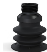
Referência da variação: 96 35NI 38D-2-GIC