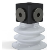
Referência da variação: 96 35SLT 18D-3-BD