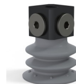
Referência da variação: 96 35NR 18D-3-BD