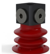
Referência da variação: 96 35SL 18D-3-BD