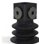
Referência da variação: 96 35NI 18D-3-BD