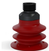
Referência da variação: 96 35SL 14D-2-GIC