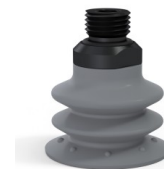
Referência da variação: 96 35NR 14D-2-GIC