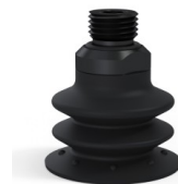
Referência da variação: 96 35NI 14D-2-GIC