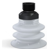
Referência da variação: 96 35SLT 14D-2-GIC