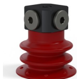
Referência da variação: 96 25SL FM5BD