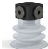
Referência da variação: 96 25SLT FM5BD