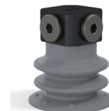
Referência da variação: 96 25NR FM5BD