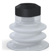
Referência da variação: 96 25SLT FM5