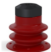
Referência da variação: 96 25SL FM5