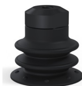
Referência da variação: 96 25NI FM5