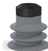
Referência da variação: 96 25NR FM5