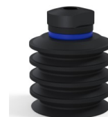
Referência da variação: 92 50NI 18D-2-F