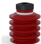
Referência da variação: 92 50SL 18D-2-F