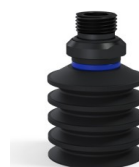
Referência da variação: 92 40NI 38D-2-GIC