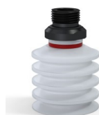
Referência da variação: 92 40SLT 38D-2-GIC