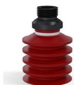
Referência da variação: 92 40SL 38D-2-GIC