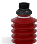
Referência da variação: 92 40SL 38D-2