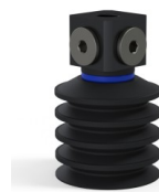
Referência da variação: 92 40NI 18D-3-BD