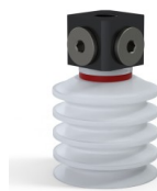
Referência da variação: 92 40SLT 18D-3-BD