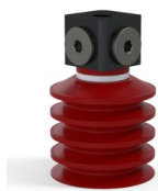
Referência da variação: 92 40SL 18D-3-BD