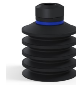
Referência da variação: 92 40NI 18D-2-GIC