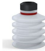
Referência da variação: 92 40SLT 18D-2-GIC