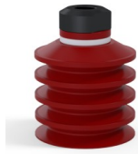
Referência da variação: 92 40SL 18D-2-GIC