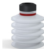
Referência da variação: 92 40SLT 18D-2