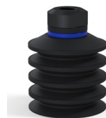
Referência da variação: 92 40NI 18D-2