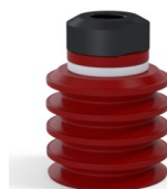
Referência da variação: 92 30SL 18D-2-GIC