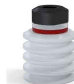
Referência da variação: 92 30SLT 18D-2-GIC