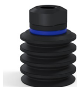
Referência da variação: 92 30NI 18D-2-GIC