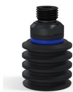
Referência da variação: 92 30NI 14D-2-GIC