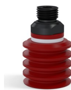
Referência da variação: 92 30SL 14D-2-GIC