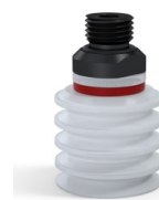
Referência da variação: 92 30SLT 14D-2-GIC