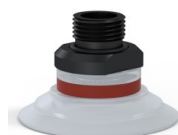
Referência da variação: 9 50SLT 38D-2