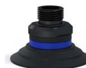
Referência da variação: 9 50NI 38D-2