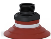
Referência da variação: 9 50SL 38D-2