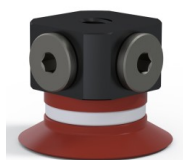
Referência da variação: 9 20SL FM5BD