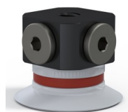
Referência da variação: 9 20SLT FM5BD