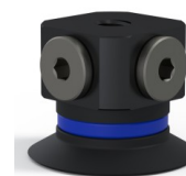
Referência da variação: 9 20NI FM5BD