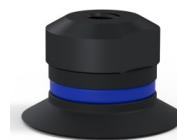
Referência da variação: 9 20NI FM5