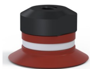
Referência da variação: 9 20SL FM5