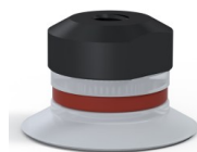
Referência da variação: 9 20SLT FM5