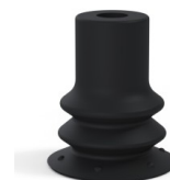
Referência da variação: 96 15NI A