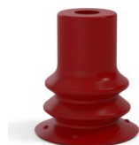
Referência da variação: 96 15SL A