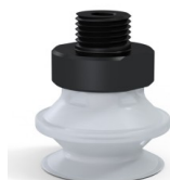
Referência da variação: 91 20SLT M18