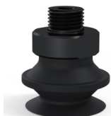
Referência da variação: 91 20NI M18