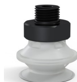
Referência da variação: 91 20TPU M18