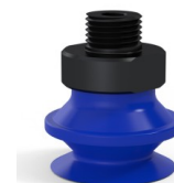
Referência da variação: 91 20PU M18