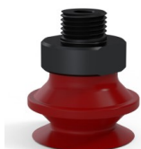
Referência da variação: 91 20SL M18