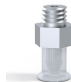
Referência da variação: 9 07SLT M5M