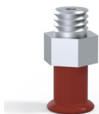
Referência da variação: 9 07SL M5M