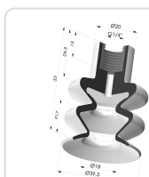
Ventosa 2.5 Fole Série 8B Ø 40MM