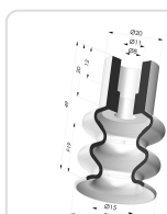
Ventosa 2.5 Fole Série 8B Ø 30MM Referência do produto: 8B 30-- A