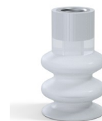
Referência da variação: 8B 30SLT F14 • Cor: Translúcido • Matéria: Silicone