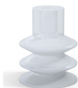
Referência da variação: 83 30SLT A