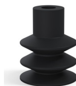
Referência da variação: 83 30NI A