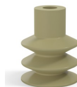
Referência da variação: 83 30CN A