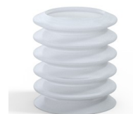
Referência da variação: 81 36SLT A SH40