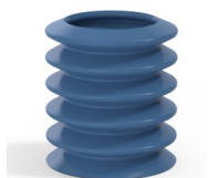
Referência da variação: 81 36SLBLEU A SH30