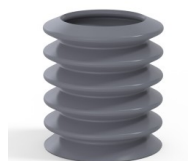
Referência da variação: 81 36SLDG A