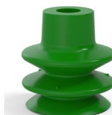
Referência da variação: 80A 27SLV A