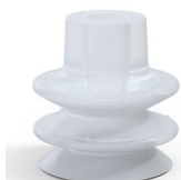
Referência da variação: 80A 27SLT A