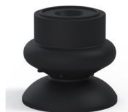
Referência da variação: 80A 25NI A