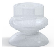
Referência da variação: 80A 25SLT A