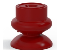
Referência da variação: 80A 25SL A SH30