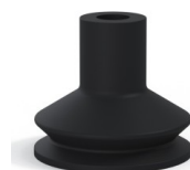
Referência da variação: 8 45NI A