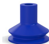
Referência da variação: 8 45PU A