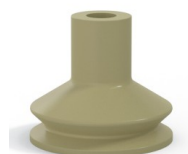
Referência da variação: 8 45CN A