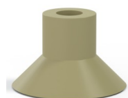
Referência da variação: 78 30CN A