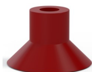
Referência da variação: 78 30SL/RV A