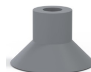
Referência da variação: 78 30NR A