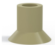
Referência da variação: 75 20CN A