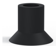
Referência da variação: 75 20NI A