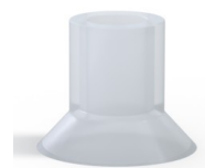
Referência da variação: 75 20SLT A