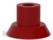
Referência da variação: 75 15SL A