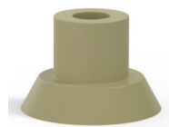
Referência da variação: 75 15CN A