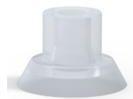
Referência da variação: 75 15SLT A SH40