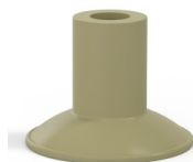
Referência da variação: 7 26CN A