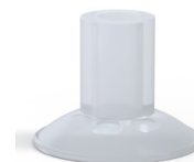
Referência da variação: 7 26SLT A