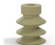
Referência da variação: 21 18CN A