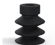
Referência da variação: 21 18NI A