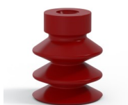
Referência da variação: 21 18SL A