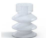
Referência da variação: 21 18SLT A