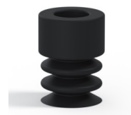
Referência da variação: 21 07NI A