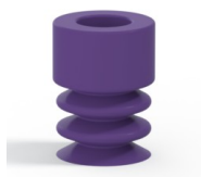
Referência da variação: 21 07MNT A