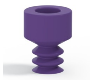
Referência da variação: 21 05MNT A