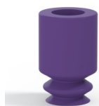
Referência da variação: 1 05MNT A