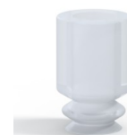
Referência da variação: 1 05SLT A