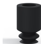
Referência da variação: 1 05NI A