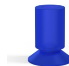
Referência da variação: 76 17VI A