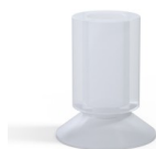
Referência da variação: 76 17SLT A SH40