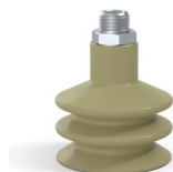
Referência da variação: 8B 50CN M14