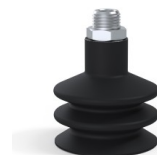
Referência da variação: 8B 50NI M14