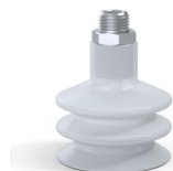
Referência da variação: 8B 50SLT M14