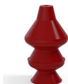
Referência da variação: 81 30SL A