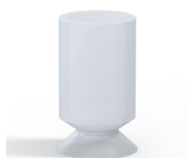
Referência da variação: