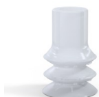
Referência da variação: 88B 20SLT A SH40