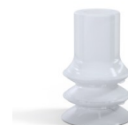
Referência da variação: 88B 20SLT A