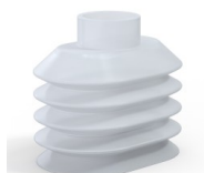
Referência da variação: 4PA56 38 50SLT A