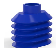
Referência da variação: 4PA56 38 50SLBLEU A