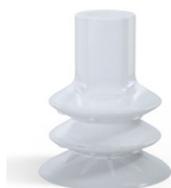
Referência da variação: 88B 40SLT A