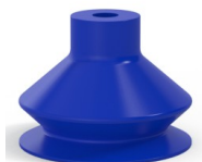
Referência da variação: 8SB 40TPUB A