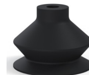
Referência da variação: