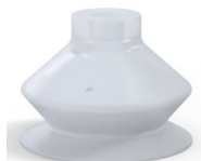
Referência da variação: