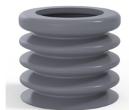
Referência da variação: 8K 45SLDG A