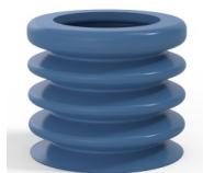
Referência da variação: 8K 45SLBLEU A SH30