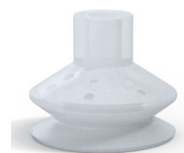
Riferimento variante: 84 50SLT A