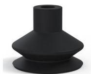
Riferimento variante: 84 50NI A