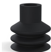
Riferimento variante: 82 32NI A