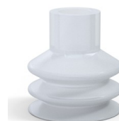
Riferimento variante: 82 32SLT A