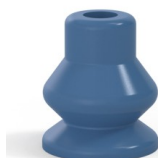
Riferimento variante: 8 13SLBLEU A SH30