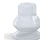
Riferimento variante: 8 13SLT A