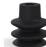
Référence déclinaison : 80A 27NI A