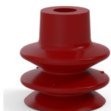
Référence déclinaison : 80A 27SL A SH40