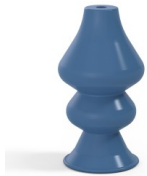
Référence déclinaison : 8 34SLBLEU A SH30