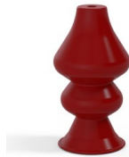
Référence déclinaison : 8 34SL A