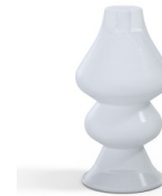
Référence déclinaison : 8 34SLT A